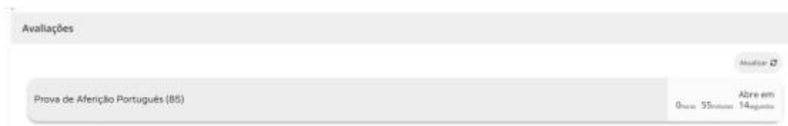
Figura 2 - Acesso à prova a realizar