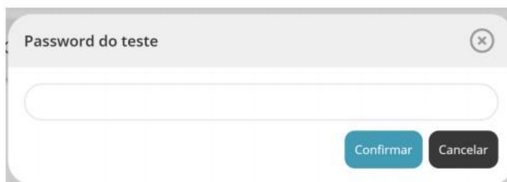
Figura 3 - Pedido da senha de acesso à prova a realizar