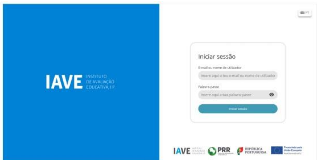
Figura 1 - Acesso à Plataforma de Realização das Provas Eletrónicas do IAVE

(Obs.: Para as escolas que optaram pelo offline em rede ou standalone , os procedimentos para acederem à Plataforma de Realização das Provas Eletrónicas do IAVE irão ser oportunamente divulgados)